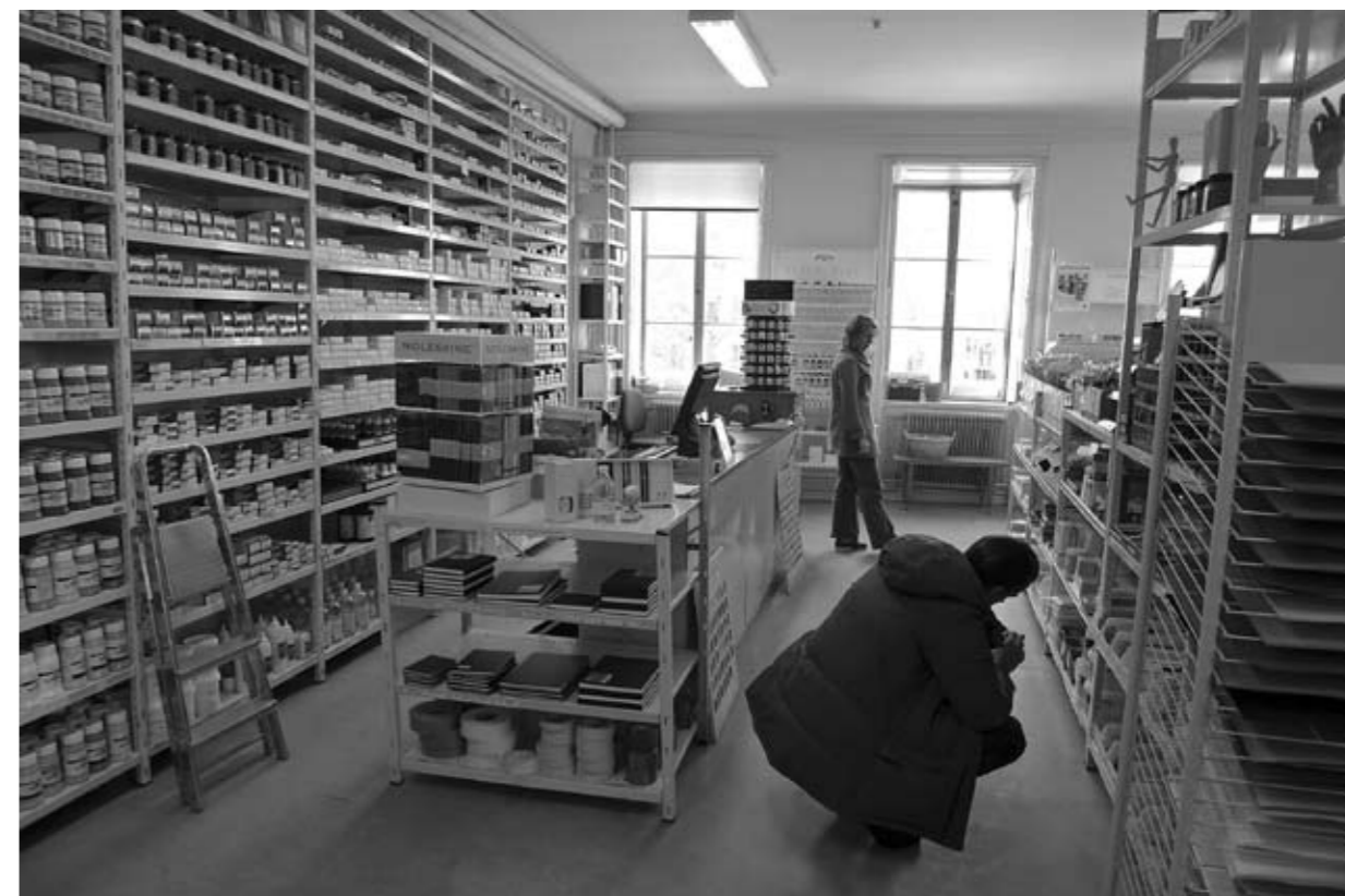
Butiken på Fiskargatan 1 i Stockholm.